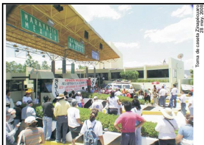
Toma de caseta Zinapécuaro 28 may. 2008