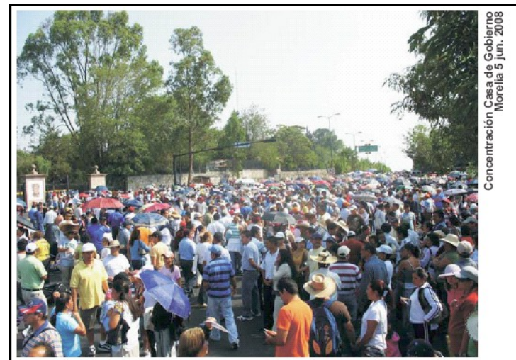
Concentración Casa de Gobierno Morelia 5 jun.2008