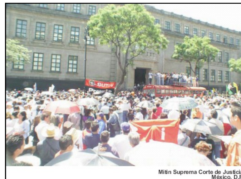
Miñ Supreme Corte de Justicia México, D.F.