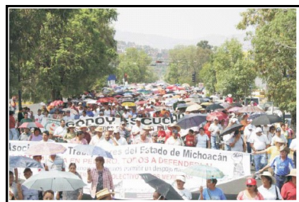
Concentración Casa de Gobierno Morelia 5 jun. 2008